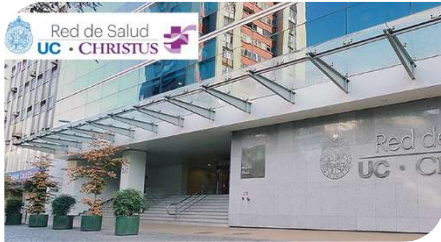
Marcoleta 367 Santiago, Región Metropolitana

Proyecto de construcción de nueva sala de calderas para el reemplazo de calderas de generación de vapor (combustible petróleo) por nuevas calderas de condensación a gas natural ( CTUe ®).